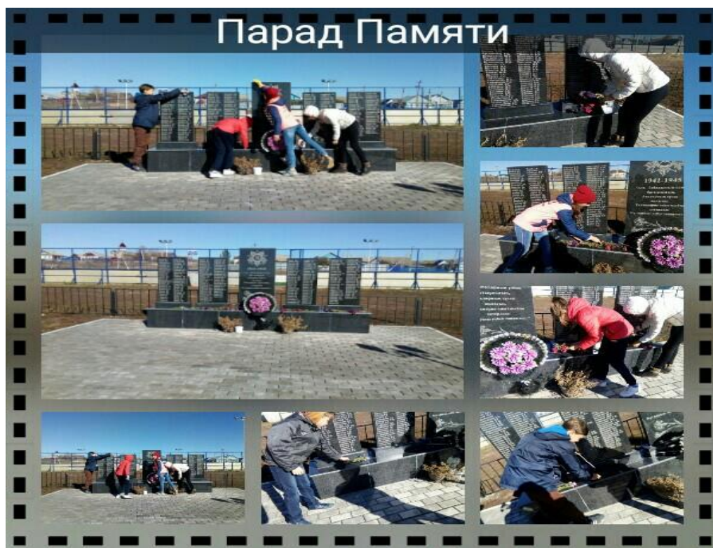
Ученики 7 класса на субботнике в Парке Победы