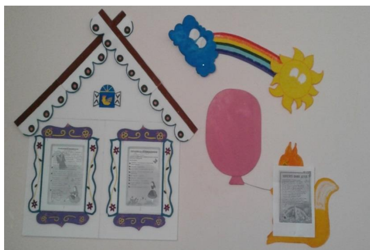
«Уголок сюжетно-ролевых игр»